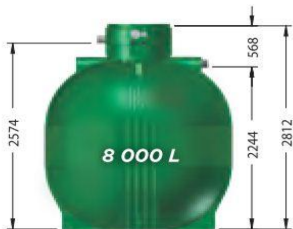
ET08000, poids : 326 kg