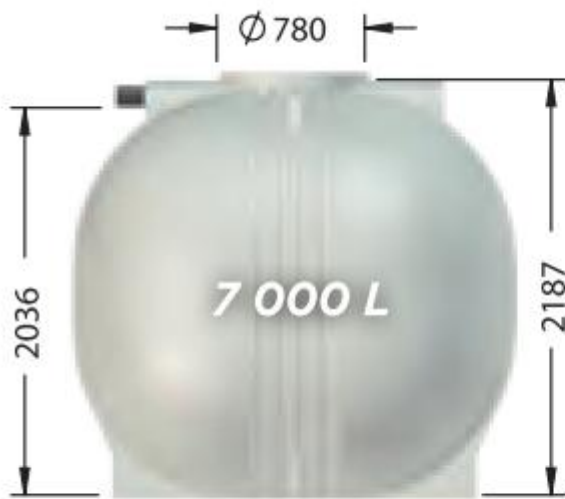
ET07000FW, poids : 283 kg