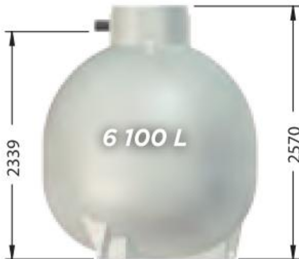
ET06000FW, poids : 179 kg