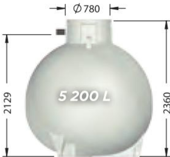
ET05000FW, poids : 166 kg