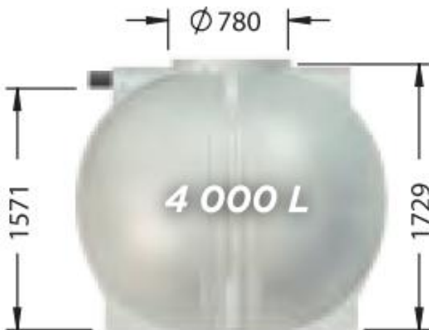
ET04000FW, poids : 178 kg