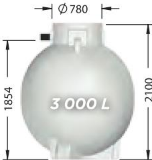
ET03000FW, poids : 106 kg