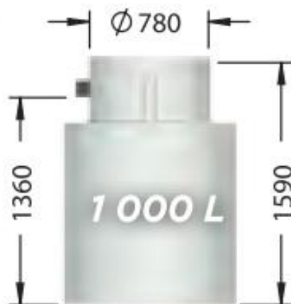
ET01000FW, poids : 70 kg